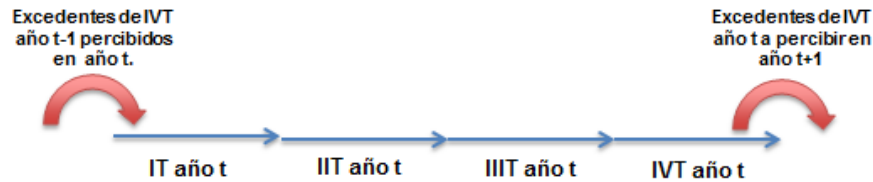
Figura 1. Esquema de traspasos de Codelco al Fisco

Así, durante el año 2017, se produjo un desfase de traspasos de dividendos que totaliza aproximadamente US$324 millones de ingresos que serán percibidos en el año 2018, a pesar de haber sido devengados en el año anterior.