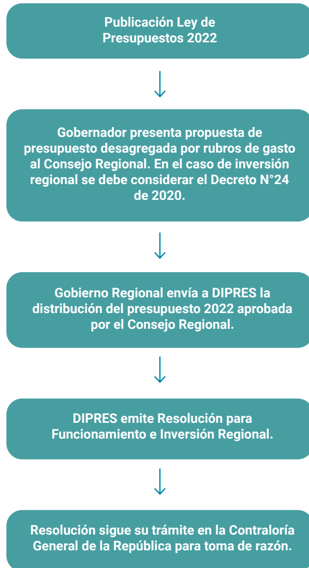
DIAGRAMA N° 1: PASOS PARA DETERMINAR EL PRESUPUESTO INICIAL DE CADA GOBIERNO REGIONAL