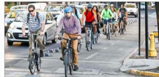
CONGESTIÓN CICLISTA.— En vías como Rosas y Miguel Claro se generan cotidianos tachos de bicicletas. En Ricardo Lyon, incluso, hay situaciones de riesgo con ciclistas que cruzan desde la ciclovía, por toda la calzada, para alcanzar la calle Loía, hacia al oriente.

Para el subsecretario de Transportes, Cristián Bower, el casi millón de viajes en bicicletas cada día en Santiago "significa la irrupción masiva, es un nuevo modo de transporte, puesto que la bicicleta es usada mayoritaria-