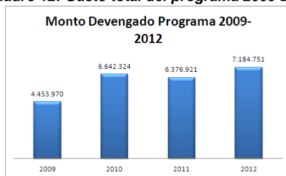
Cuadro 12: Gasto total del programa 2009-2012

Estas variaciones en el gasto total del programa son el resultado del comportamiento del gasto de los subcomponentes, razón por la cual se analizan en el apartado gasto por subcomponente.