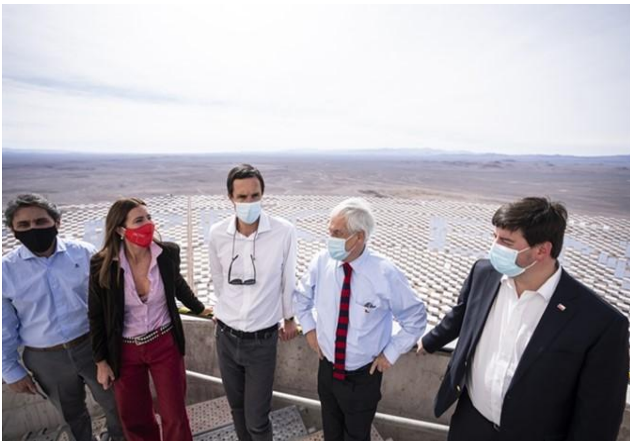
Inauguración Primer Proyecto Concentración Solar Potencia de Latinoamérica, Cerro Dominador, Región de Antofagasta. Junio, 2021