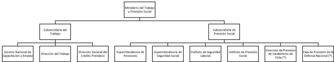
ORGANIGRAMA MINISTERIO DEL TRABAJO Y PREVISIÓN SOCIAL

(*):Tuición financiera, conforme al Decreto Ley N° 1.263 del año 1975.