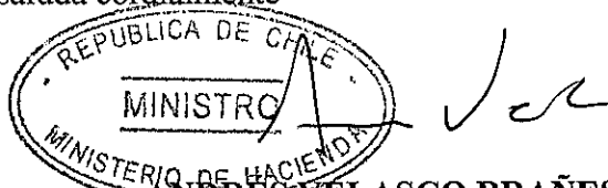
ANDRÉS VELASCO BRAÑES MINISTRO DE HACIENDA

Sin otro particular, le saluda cordialmente