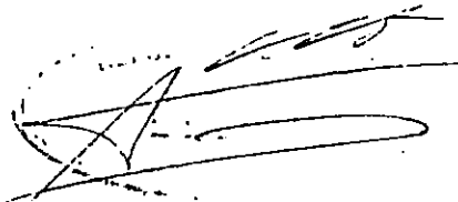
ALBERTO ARENAS DE MESA MINISTRO DE HACIENDA

Lo que transcribo a usted para su conocimiento