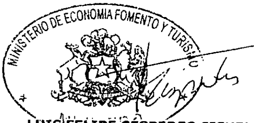
LUIS FELIPE CÉSPEDES CIFUENTES MINISTRO DE ECONOMÍA, FOMENTO Y TURISMO

POR ORDEN DE LA PRESIDENTA DE LA REPÚBLICA