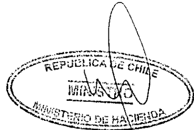
RODRIGO VALDÉS PULIDO MINISTRO DE HACIENDA