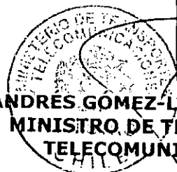
ANDRÉS GÓMEZ-LOBO ECHENIQUE MINISTRO DE TRANSPORTES Y TELECOMUNICACIONES