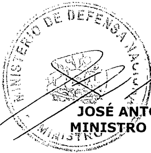
JOSÉ ANTONIO GÓMEZ URRUTÍA MINISTRO DE DEFENSA NACIONAL